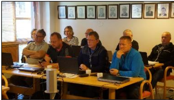
Kurs i prosjektlederkompetanse