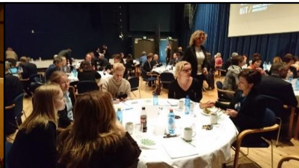
Møte om næring i nord med statsministeren 16. mars i Alta