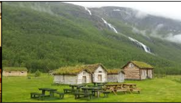
Lokalkunnskap – Holmenes i Kåfjord