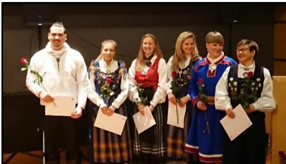
Ferdige sykepleiere i Nord-Troms, kull 2015