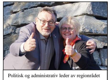
Politisk og administrativ leder av regionrådet